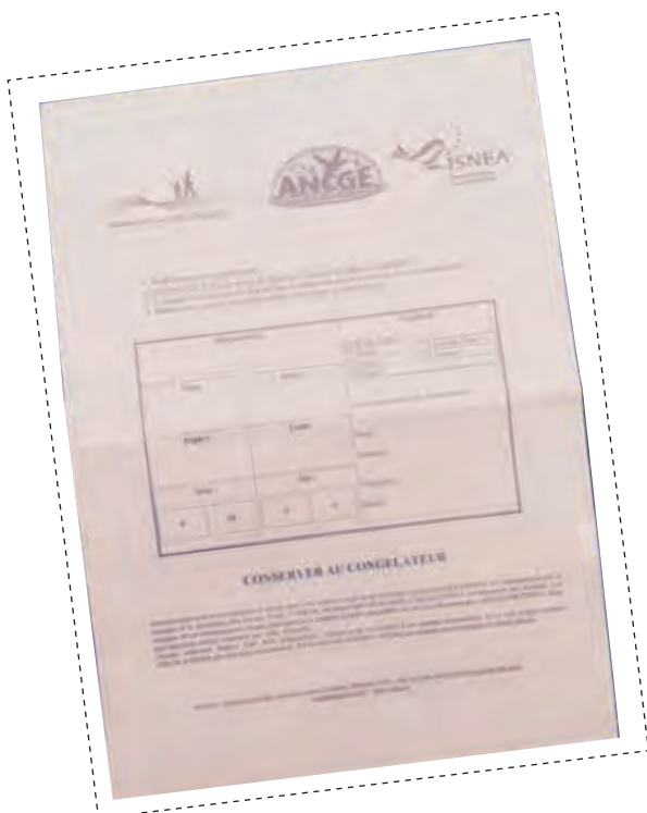
Modèle d'enveloppe pour collecte de plumage d'anatidés

Sébastien FARAU (FDC85) sfarau@chasse85.fr 06.15.24.74.28